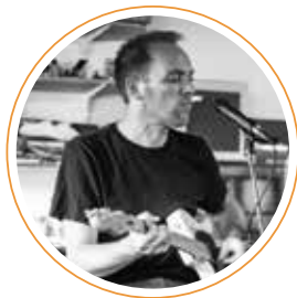
La Cie Mélocotòn